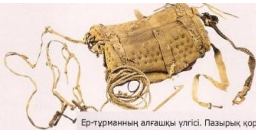
Ер-тұрманның алғашқы үлгісі. Пазырық қорғаны